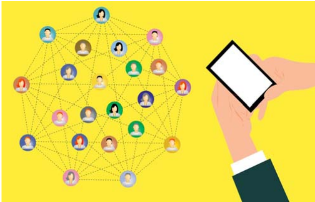
ฝ่ายขาย / ฝ่าย การตลาด Sales & Marketing