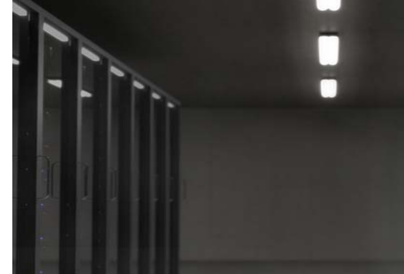
ฝ่ายเทคโนโลยี สารสนเทศ IT / CIO office