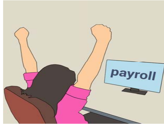
ฝ่ายทรัพยากรบุคคล HR